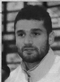
Antonio Candreva, della Lazio